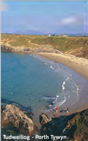
Tudweiliog - Porth Tywyn

Partiau a thrwsio - Llŷn Cycle Centre, Yr Ala, Pwllheli. Ffôn: 01758 612414.